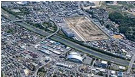
※画像はおすすめ情報のみ